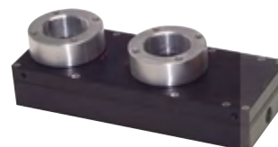
Typ VLP 16