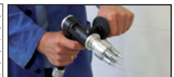
Typ MultiJet mit 50 mm Düse