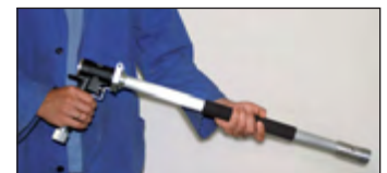
Typ Standard mit 1200 mm Düse und Komfortbetätiger