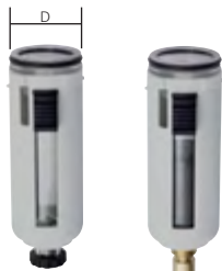
Typ BF 1 F