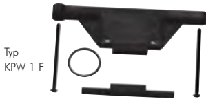
Typ KPW 1 F