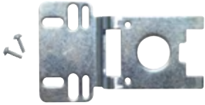
Typ W 1 F