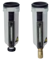
Typ BFM 1 F