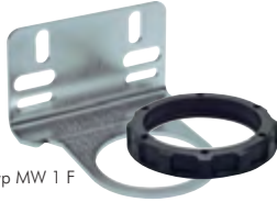
Typ MW 1 F