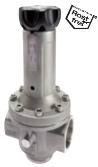
Typ G 1 1/2"