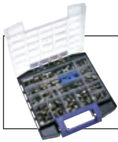
Multibox RiB Steckanschlüsse MSV von 4 bis 8 mm auf Seite 958