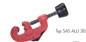
Typ SAS ALU 30