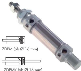
ZDPM (ab Ø 16 mm)