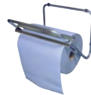
Typ PUTZR ABROLLW