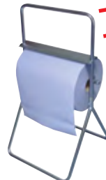
Typ PUTZR ABROLL B