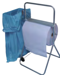
Typ PUTZR ABROLL