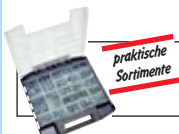
praktische Sortimente Schrauben, Muttern, Schrauben, Fittings, O-Ringsortimente, ..... ab Seite 958

Alle Angaben verstehen sich als unverbindliche Richtwerte! Für nicht schriftlich bestätigte Datenauswahl übernehmen wir keine Haftung. Druckangaben beziehen sich, soweit nicht anders angegeben, auf Flüssigkeiten der Gruppe II bei +20°C.