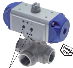
für Namuranschluss und IG

Achtung: Bei hohen Medientemperaturen muss der Antrieb ggf. gekühlt werden!