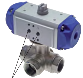
für Namuranschluss und IG

TIP: Anschlussbild nach NAMUR, mit Innengewinde!