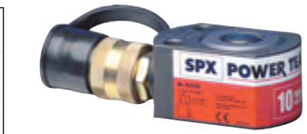
Typ RLS 100