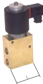
Typ für hohe Durchflusswerte

Diese Ventile werden grundsätzlich mit Spule und Stecker ausgeliefert!