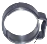
Typ mit Einlagering