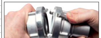
Option: mit Verriegelung