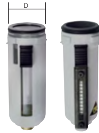
Typ BOL 1 F Typ BOLM 1 F